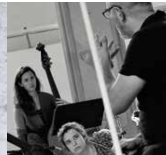
Musique des lumières