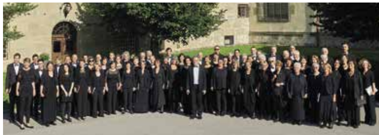
Chœur de chambre de l'Université de Fribourg

D'autre part, l'exemple de Johann Sebastian Bach, puissante figure tutélaire et modèle musical incontournable, aura forcément influencé Mendelssohn, lui-même devenu la cheville ouvrière de la vie artistique de Leipzig. D'où le bon mot attribué à Berlioz: «Il n'y a qu'un Dieu à Leipzig, c'est Bach, et Mendelssohn est son prophète».