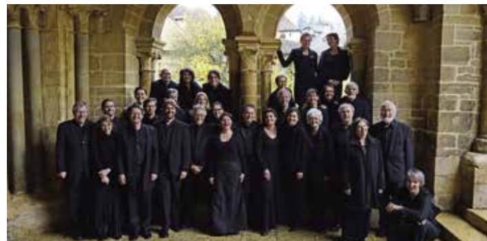
Les vocalistes romands

Quinze ans plus tard, pour une raison que l'on ignore, Bach reprit sa Messe et la compléta pour former un grand corpus respectant le schéma catholique. Il y ajouta ainsi un Credo, appelé Symbolum Nicenum, un Sanctus et un Agnus Dei. La plupart des nouveaux mouvements sont également des adaptations d'œuvres antérieures, à l'exception de trois pièces originales qui constituent peut-être le véritable testament musical du compositeur.